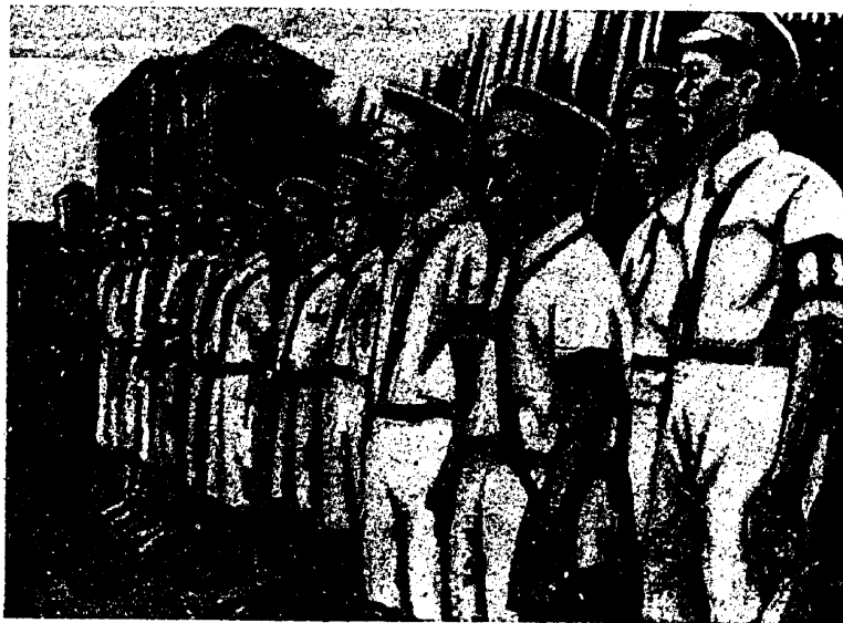
די ארבעטער-גווארדיע אין קאנטאן

סמראנמן, דערביי האבן די פאליציאנטן גאכגעשאסן מיט אויפרייס- קוילן אפילע נאך די אנטלויפנדיקע מענטשן. דער רעזולטאט איז געווען אסאך געהארגעטע און פארוואונדעטע. דאס האט ארויס- גערופן א שרעקלעכן צארן-אויפרייס פון דער גאנצער שאנכאיער באפעלקערונג. צו די פארשמריקטע טעקסטיל-ארבעטער האבן זיך פארייניקט די ארבעטער פון דער עלעקטרישער סטאנציע, די